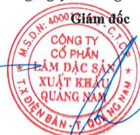
Quảng Thanh Bình