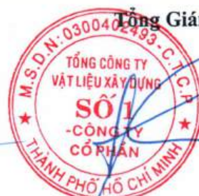
Cao Trường Thụ