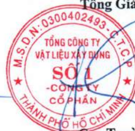
Cao Trường Thụ