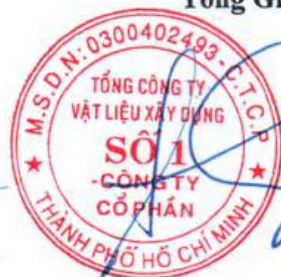
Cao Trường Thụ