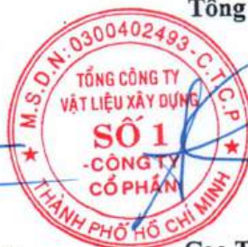
Cao Trường Thụ