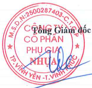
Trần Đặng Công