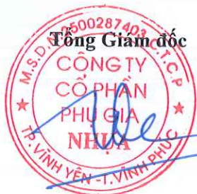
Trần Đặng Công