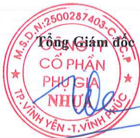
Trần Đặng Công