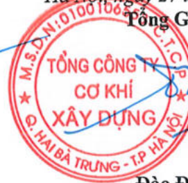
Đào Đức Thọ