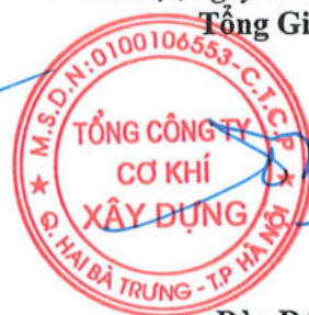
Đào Đức Thọ