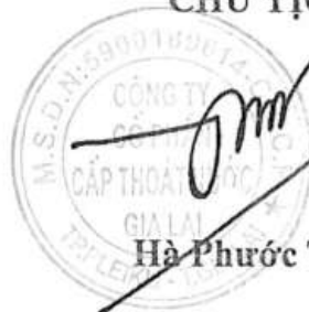
Hà Phước Tuấn