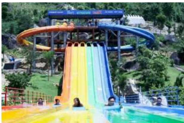
Công viên nước