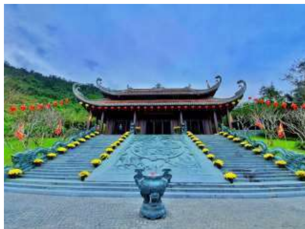
Đền thần tài