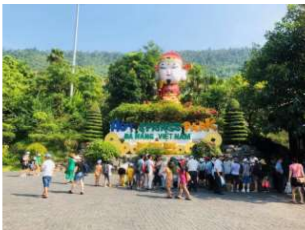
Công viên suối khoáng nóng Núi Thần Tài

Một số hình ảnh Công viên suối khoáng nóng Núi Thần Tài