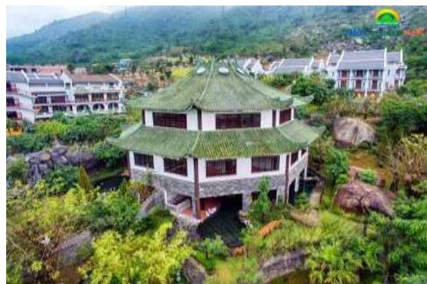
Khu khách sạn