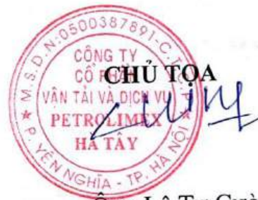
Ông Lê Tự Cường