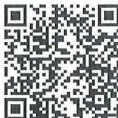
Mã QR 02

THAY MẶT HỘI ĐỒNG QUẢN TRỊ FOR AND ON BEHALF OF BOD