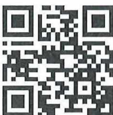
Mã QR 01