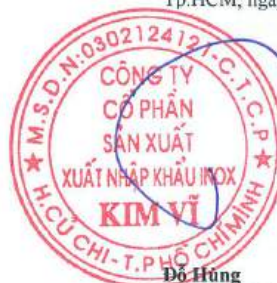
Đỗ Hùng Chủ tịch Hội Đồng Quản Trị