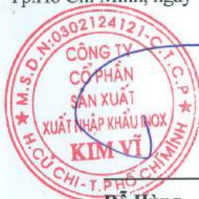
Đỗ Hùng Chủ tịch Hội Đồng Quản Trị