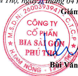
Trần Bích Thủy