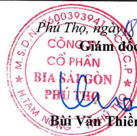
Trần Bích Thủy