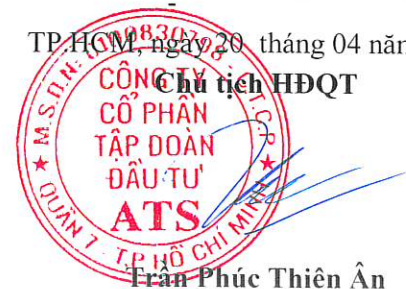
Trần Phúc Thiên Ân