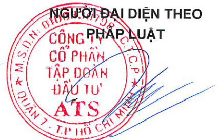
Trần Phúc Thiên Ân