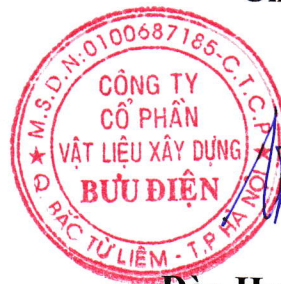
Đào Huy Trường