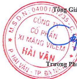
Trương Phú Cường