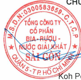
Koh Poh Tiong