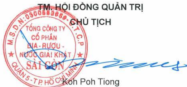
Koh Poh Tiong