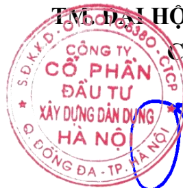
Đỗ Tiến Lợi