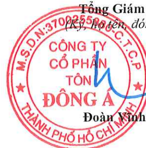
Đoàn Vĩnh Phước