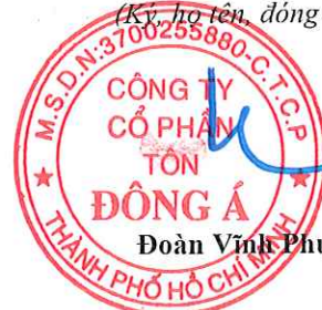
Đoàn Vĩnh Phước