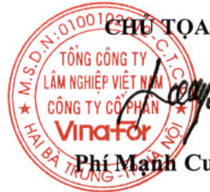
Phí Mạnh Cường