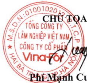
Phí Mạnh Cường