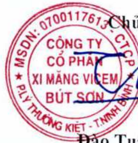
Đào Tuấn Khôi