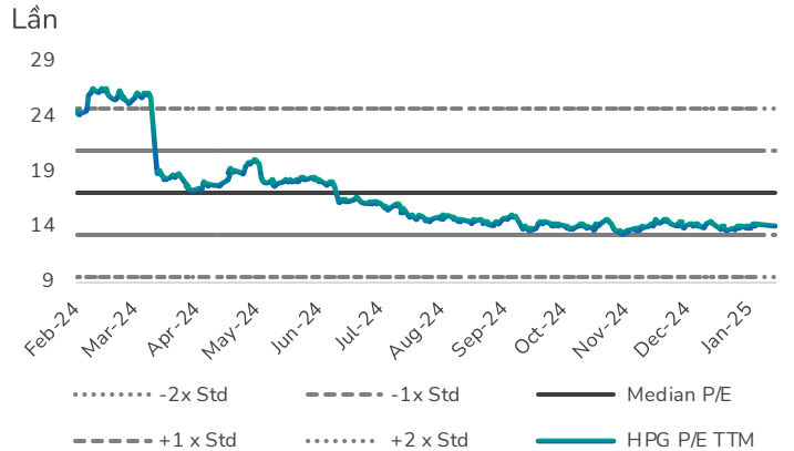
Hình 3: Định giá P/E