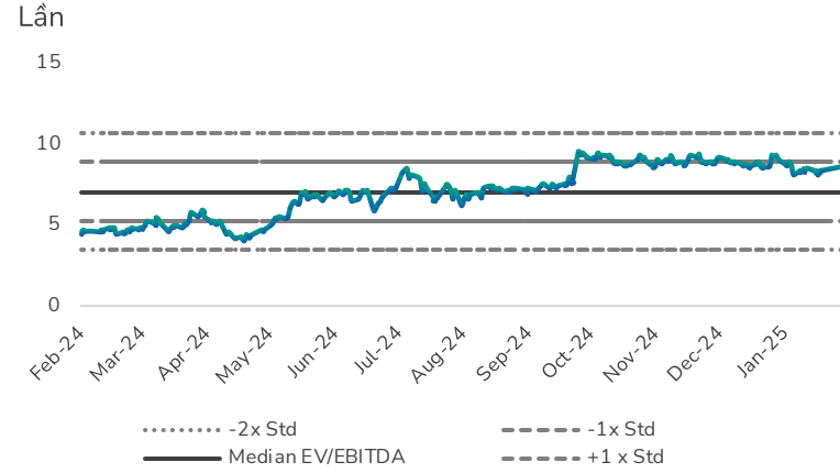
Hình 2: Định giá EV/EBITDA