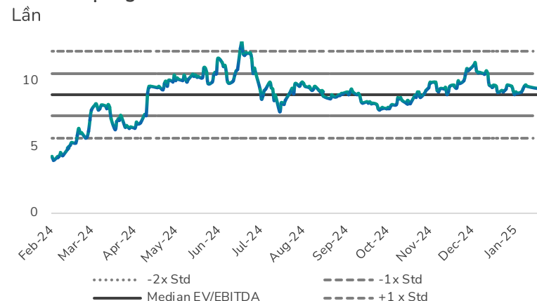
Hình 2: Định giá EV/EBITDA