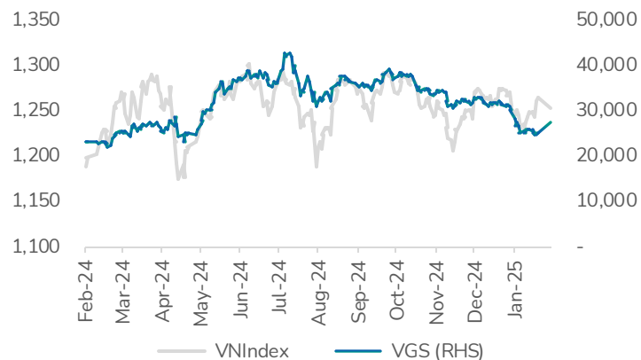
Hình 1: Giá cổ phiếu và VnIndex VND/cổ phiếu

KHUYẾN NGHỊ: MUA Giá mục tiêu: 35,500 Upside: +24%