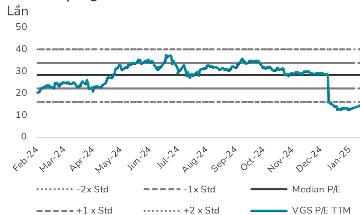
Hình 3: Định giá P/E