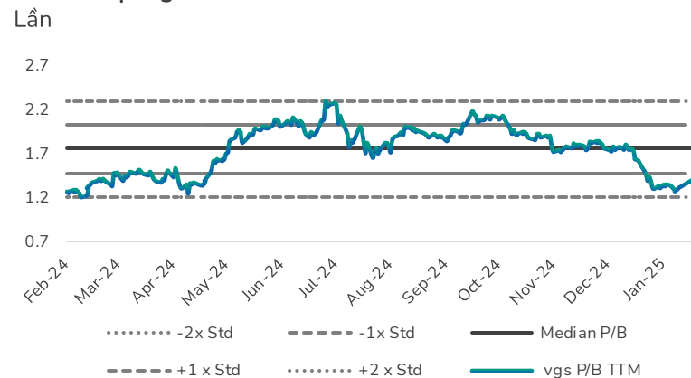
Hình 4: Định giá P/B