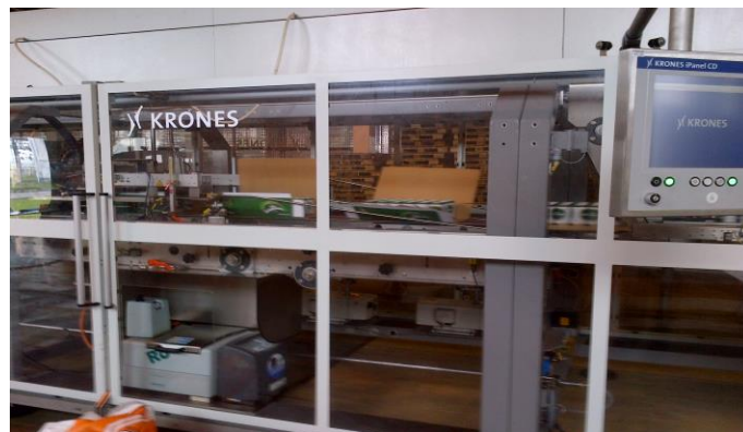
Công đoạn đóng gói sản phẩm