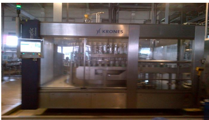
Công đoạn thanh trùng và chiết bia vào lon