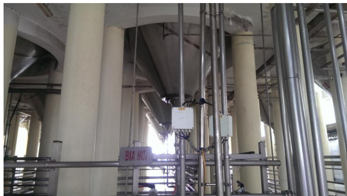
Công đoạn kết lắng và lên men và ủ bia (kéo dài 21 ngày)