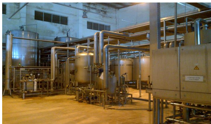
Công đoạn lọc và pha chế bia sau khi ủ