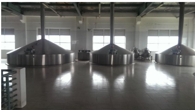
Các nồi nấu Malt, nấu gạo, bổ sung hoa bia và lọc bã