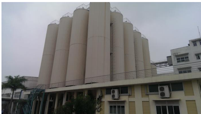
Khu vực ủ bia nhìn từ bên ngoài